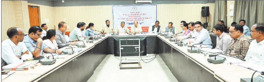
बैठक लेते पिछड़ा वर्ग कल्याण आयोग के अध्यक्ष।

उन्होंने बुधवार को कलेक्टर सभाकक्ष में आयोजित विभागीय समीक्षा बैठक में विभिन्न योजनाओं की प्रगति की जानकारी ली और अधिकारियों को निर्देशित किया कि पिछड़ा वर्ग के अधिक से अधिक हितग्राही शासकीय योजनाओं से लाभान्वित हों। बैठक में आयोग के