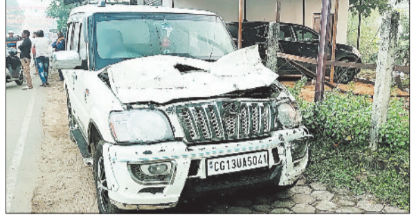
दुर्घटनाग्रस्त स्कार्पियो वाहन।