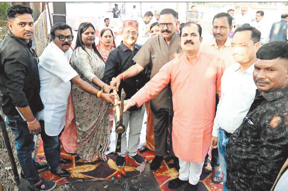
भूमि-पूजन करती महापौर, सभापति एवं अन्य।